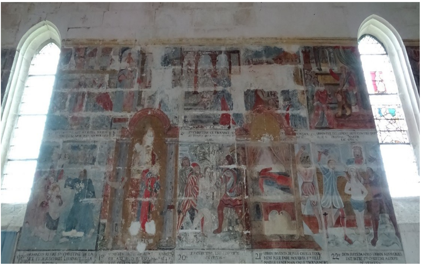
Photographie du monument historique